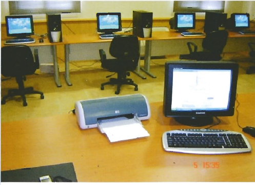
Marmaris BSK Yelken Şubesi Sınav Salonu