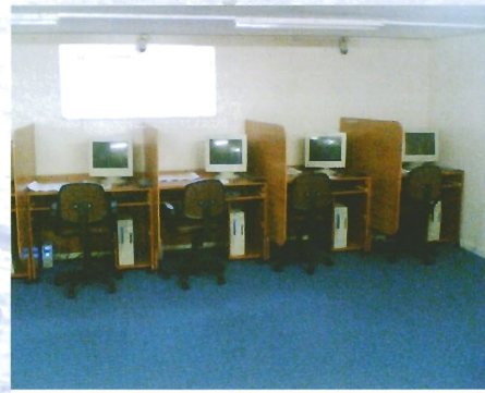
Ataköy Marina Yacht Club Sınav Salonu

ADE, sivil toplum örgütü olmak sorumluluğuyla başdaştırarak 2008 yılı ikinci yarısında başlattığı M.E.B. onaylı özel ADEK kurslarıyla bir başka yeniliği de amatör denizci topluluğunun hizmetine sunmuştur.