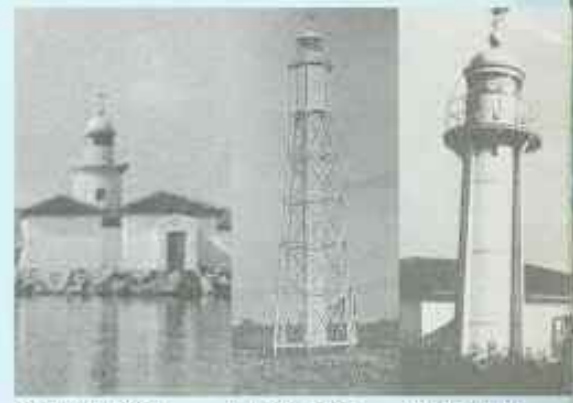
BODRUM 1880 BAFRA 1880 KEPEZ 1936