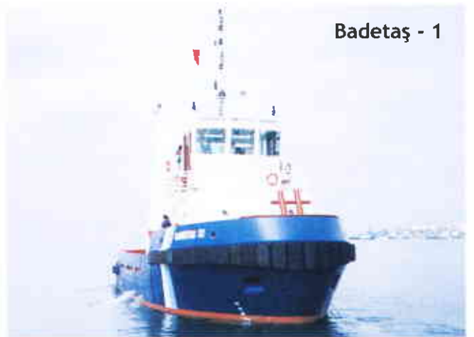
Badetaş - 1