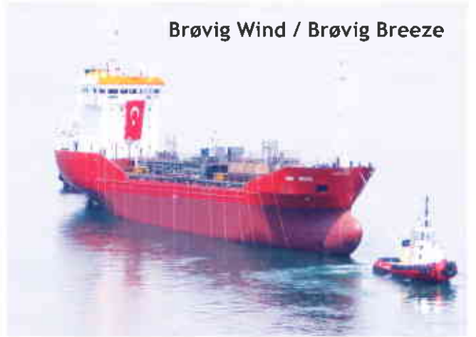
Brøvig Wind / Brøvig Breeze